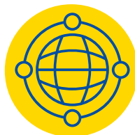
Фонд «З'єднуємо Європу»/ Connecting Europe

У 2022 році Україна вже приєдналася до програм Digital Europe , Fiscalis , Customs , EU4Health та LIFE .