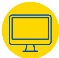
Програма єдиного ринку (SMP)

Україна приєднується до інших ключових програм фінансування ЄС, які допоможуть Україні в подальшому одержувати користь від співпраці з ЄС та узгодити свої доробки за ключовими напрямками: